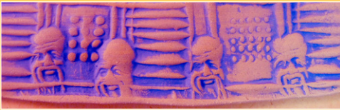
Inwassen van een (biscuit gestookt) reliëf *