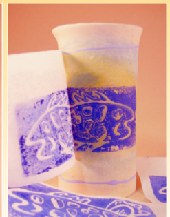
Maken van rijstpapiertransfers **