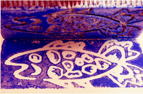
Stempel-/vlakdruk op droge of biscuitgebakken klei *

Stempel, kleur, tamponeer, was in, transfereer en ontdek... met je eigen ingekleurde pasta!