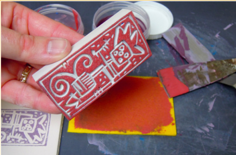
KERPA - Stempeldruk ◊