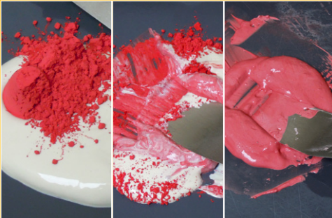
Maken van ingeleurde KERPA

INKLEURBAAR / OLIEHOUDEND / WATEROPLOSBAAR / MAX. 1300 °C