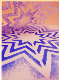
Tamponeren van sjablonen *