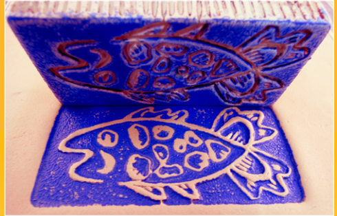
Stempel-/reliëfdruk in natte klei *