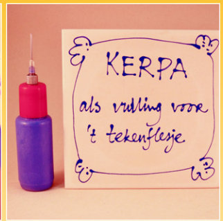
Superdekkend en hechtend slib * / vulling tekenflesje *