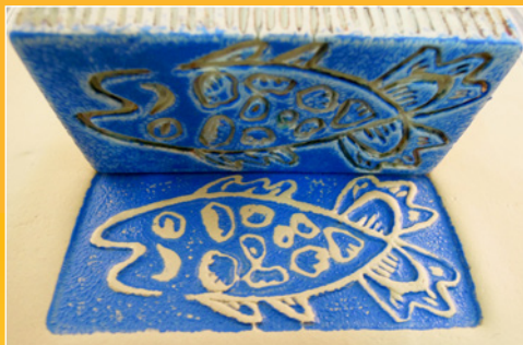
Stempel-/reliëfdruk in natte klei *