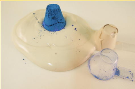
Maken van ingeleurde KERPA (Recept z.o.z.*)

INKLEURBAAR / OLIEHOUDEND / WATEROPLOSBAAR / MAX. 1300 °C