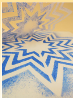
Tamponeren van sjablonen *