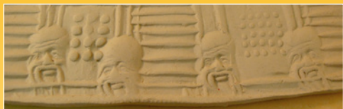
Inwassen van een (biscuit gestookt) reliëf *