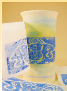
Maken van rijstpapiertransfers **