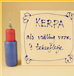
Superdekkend en hechtend slib * / vulling tekenflesje *