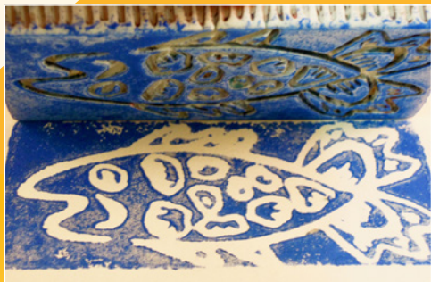
Stempel-/vlakdruk op droge of biscuitgebakken klei *

Stempel, kleur, tamponeer, was in, transfereer en ontdek... met je eigen ingekleurde pasta!